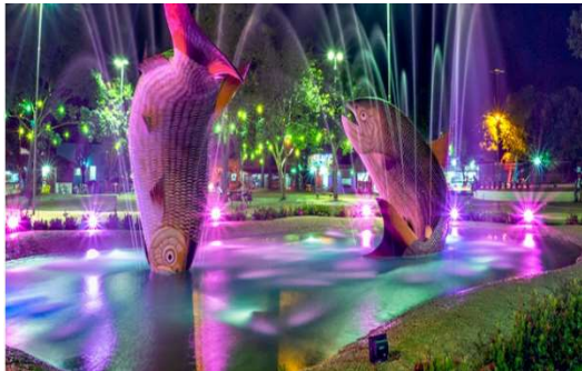
Festival de Inverno Bonito Município - MS

(Fragmento de Nota Fiscal e impostos recolhidos: COFINS, ISS e PIS).