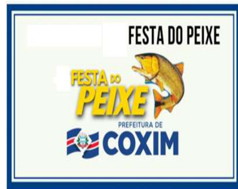
Festa do Peixe em coxim – MS.