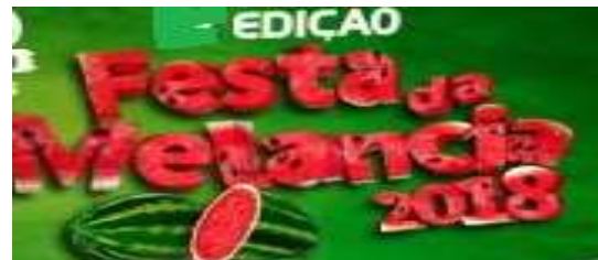
Município de Eldorado - MS