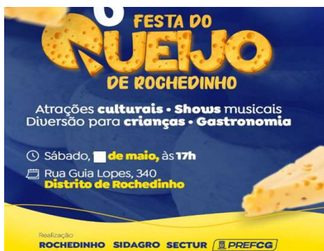
Festa do Queijo no Distrito de Rochedinho – MS.