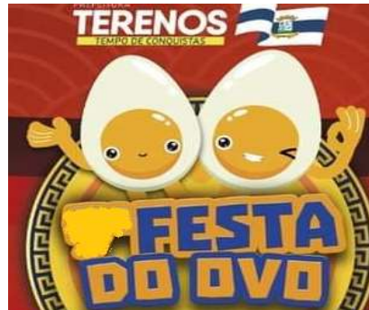
Município de Terenos - MS