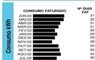
Fragmento de uma conta de luz

PIS – 1,93 R$ COFINS – 8,90 R$ ICMS 44,53 R$