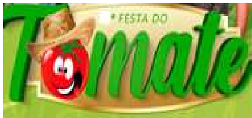
Município de Antônio João - MS